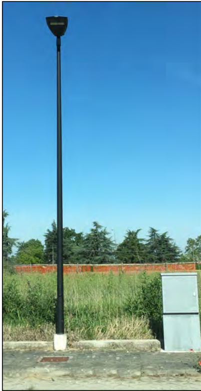
AEC ITALO 1